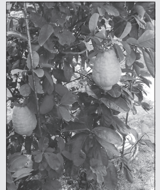
Joan Verdaguer Pratdesaba, veí de Tona, ens ha fet arribar aquestes fotografies impressionants d'una llimona de més d'un quilogram de pes, i que ha collit aquest mes de gener del llimoner de casa seva. En concret, la llimona pesa 1 kg i 100 grams. A la fotografia de dalt la podeu veure comparada amb una llimona convencional.