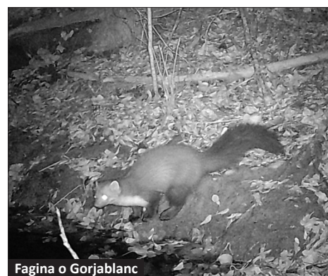
Fagina o Gorjablanc